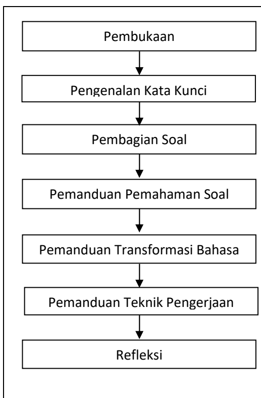
Gambar 2: Model Pembelajaran 1

Pada tahap pemahaman soal, pemandu/guru menuntun siswa secara bertahap hingga siswa memahami isi soal. Berbagai teknik dapat diterapkan dalam tahapan ini. Misal, guru dapat bertanya kepada siswa tentang makna kata, frasa, dan kalimat. Menuntun siswa menemukan kata kunci pada soal. Meminta siswa menerjemahkan sebagian kecil atau besar dari soal. Menyanyi siswa keseluruhan makna soal. Meminta siswa menerangkan isi soal, dll. Cara guru bertanya hendaknya disusun secara sistematis sehingga siswa terbiasa membentuk pola pikir yang sistematis